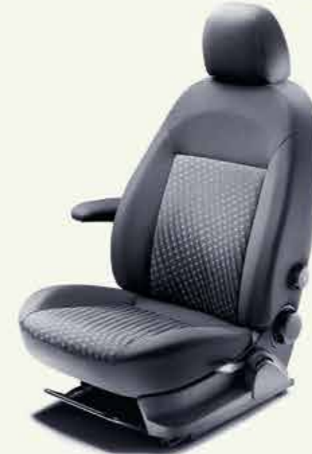
Yükseklik ve bel destek ayarlı sürücü koltuğu