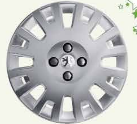
15" jant kapağı