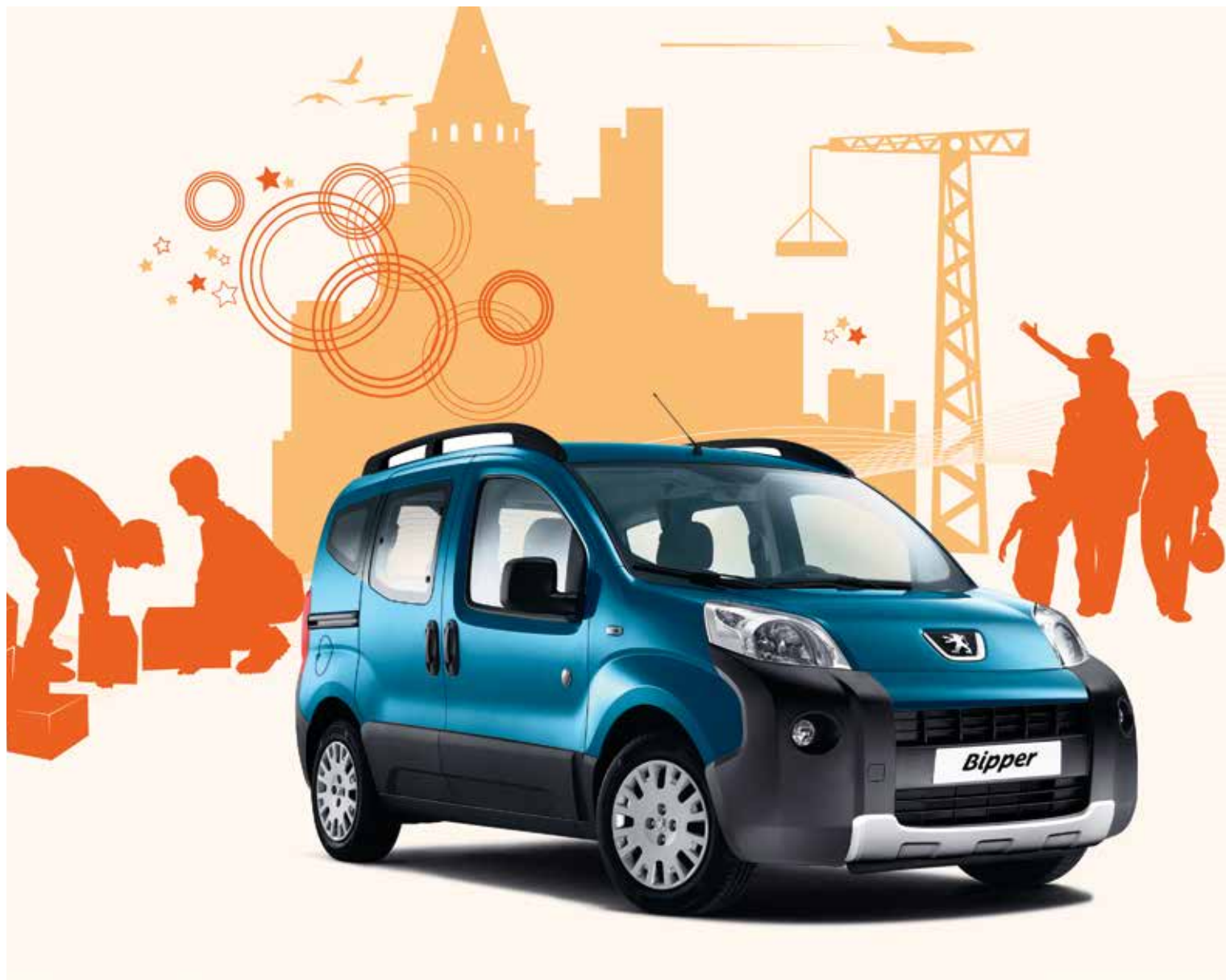
PEUGEOT BIPPER Tepee