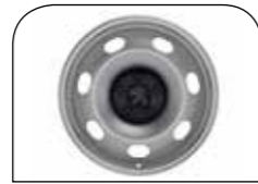
15" Yarım Jant Kapaklar